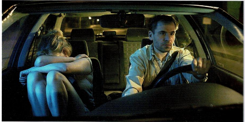
Paula Saraste, Weiter zum Wasser / Veden äärelle, 2021.

Kolmikanavaisen videoteoksen näytöille ilmestyy ihmiskasvoja, joiden kantajat on teostiedoissa mainittu "meditoijiksi". Jokainen katsoo silmät auki kameraan mustaa taustaa vasten, ja ainoa ääni on heidän hengityksensä. Koko asetelmassa on paljon tuttua liikkuvan kuvan taidehistoriasta. Toisaalta liitän sen väistämättä myös nykyajan keskittymiskyky- ja mielen-